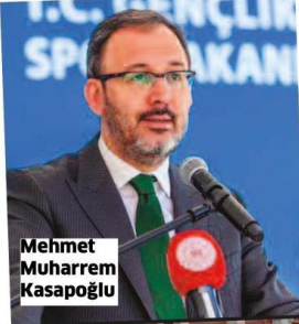
Mehmet Muharrem Kasapoğlu

Gençlik ve Spor Bakanı Mehmet Muharrem Kasapoğlu Kütahya'ya gelerek bir dizi açılış ve ziyaretler gerçekleştirdi. Ziyaretinde Kütahya'dan şampiyonların yetişeceğini söyleşen Bakan Kasapoğlu , "Önümüzdeki süreçte Kütahya'dan, ilçelerinden, köylerinden de nice şampiyonları, her alanda nice yıldızları, bu şanlı bayrağı dalgalandıracak gençleri yetiştireceğiz" dedi.